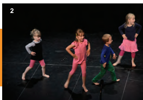
1/ Večer cirkusových kurzů – plakát 2/ z Mlejnské akademie