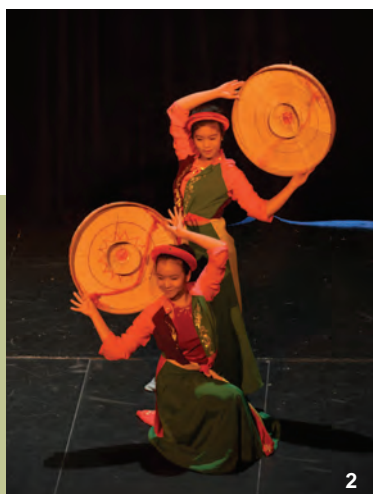
1/ Nejsme si cizí – multižánrová kulturní akce – plakát 2/ vystoupení vietnamského tanečního kroužku