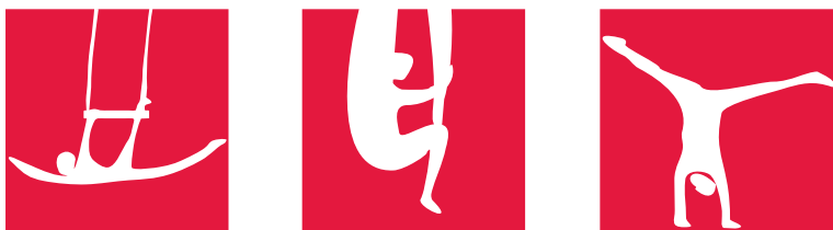
1/ Noc cirkusových divadel – plakát 2/ Festival sólové tvorby pro děti – programový plakát 3/ Porta 2014 – plakát